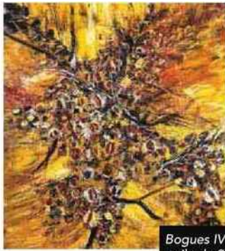
Bogues IV, une toile de 2018.